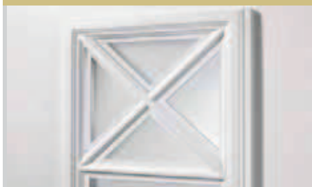
Detal: Model 8286 | ornamentyka

[A] Model 8286 | wyposażenie dodatkowe: szkło ornamentowe Chinchilla białe | pochwyt: 9035-13 stal szlachetna